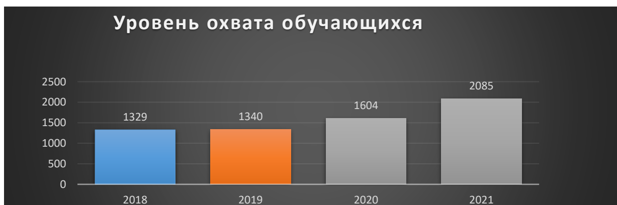
Рис. 2. Тенденция роста обучающихся в МБУ ДО ЖДТ по учебным годам