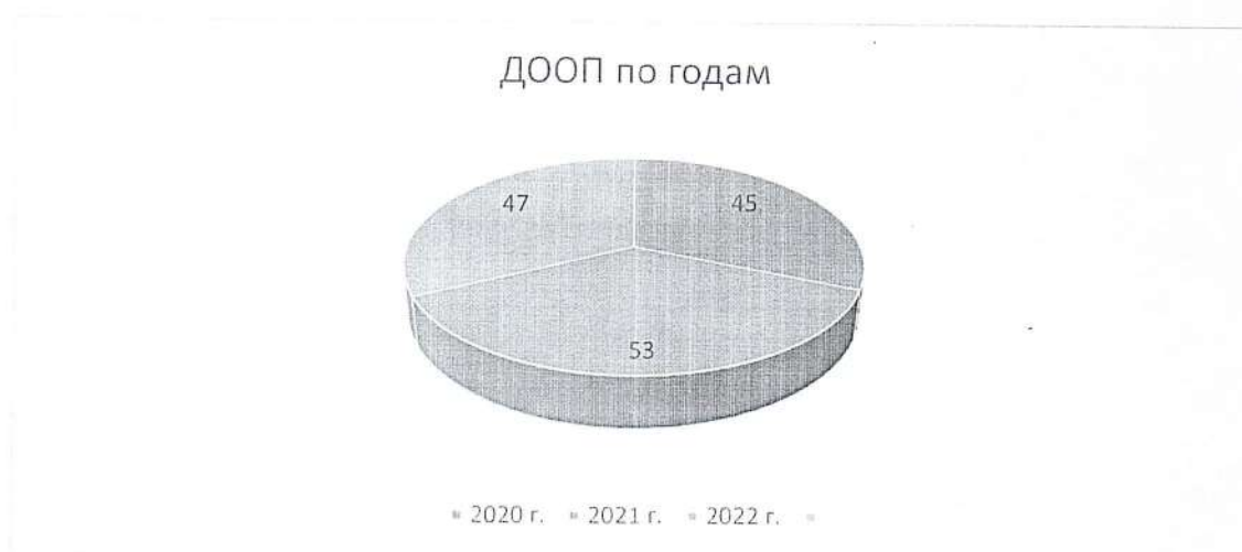
Рис. 3. Статистика реализуемых дополнительных общеобразовательных общеразвивающих программ в МБУ ДО ЖДТ по годам

Таким образом, из диаграммы видно, что средний коэффициент по образовательным программам за период с 2020 года по 2022 год составил 48,3.