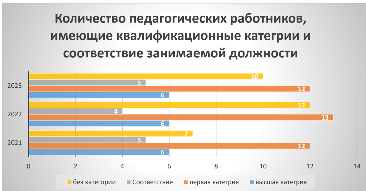
Рис. 1. Уровень повышения категоричности педагогических работников МБУ ДО ЖДТ по учебным годам.