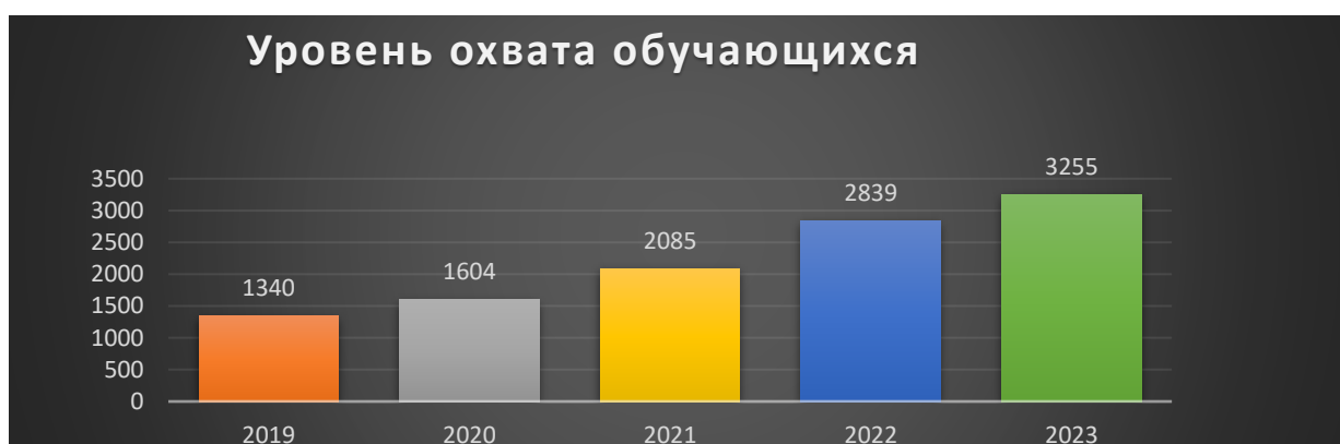
Рис. 2. Тенденция роста обучающихся в МБУ ДО ЖДТ по учебным год за 5 лет

В 2023 году дополнительные общеобразовательные общеразвивающие программы реализовались и реализуются по настоящее время в 6-ти школах города: СОШ № 13, № 26, № 40, № 48, № 51, Российская гимназия № 59.